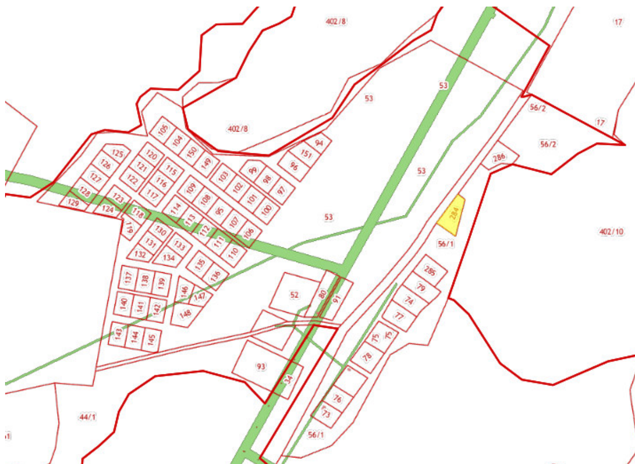
Рис. 1. Земельный участок с кадастровым номером 04:02:070403:284

Главный специалист отдела архитектуры, строительства и ЖКХ Администрации МО «Чойский район»